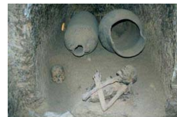
El Mawta (le tombe)

Alla scoperta di Siwa e dei dintorni:visita al tempio dell'Oracolo dove Alessandro Magno fu dichiarato faraone,figlio del dio Amon Ra..Visita a Gebel El Mawta(le tombe),e l'antica Siwa (Shali)..Il pozzo di Cleopatra. Pernottamento in hotel.