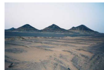
Road to Siwa

In mattinata partenza verso Siwa percorrendo l'antica pista carovaniera passando per diversi posti di blocco e si passa accanto il lago di Sitra (depressione che nell'era quaternaria era un fondale marino).Zona ricca di fossili. Al tramonto s'arriva a Siwa,sistemazione in hotel. Pernotamento.