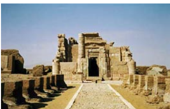
Deir El Hagar

Partenza verso Dakhlah con soste lungo la strada.Visita al Qasr,cittadella medievale islamica,antico capoluogo delle oasi. Il Qasr contiene stretti vicoli e alte case di fango. Inoltre si visita Deir El Hagar(tempio di epoca romana ben conservato. Pernottamento in hotel.