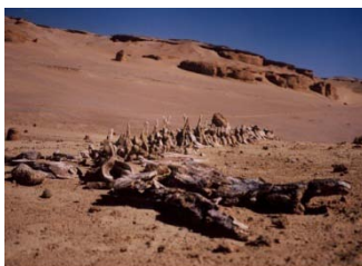
Valley of the whales

Partenza con 4x4 verso Wady Hitan Valle delle Balene, visita del sito e proseguimento verso La Caverna Djara: Grotte con stalattiti e stalagmiti formati durante la Grande fusione causata dai vulcani. Cena B.B.Q. pernottamento in tenda, tipo Igloo.