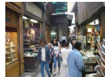
Khan El Khalili

Giornata a disposizione per giro libero al Cairo o per riposo sulla piscina del vostro albergo.