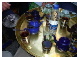
Khan El Khalili

Tutta la mattinata dedicata a godere e ammirare le meraviglie del Museo Egizio, soprattutto la collezione di Tut Ank Amon. (Possibilità di visitare le 2 sale delle mummie).Pranzo in ristorante locale.