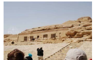
Gabal El Selsela

Visita di Gebel El Selsela e navigazione verso Kom Ombo. Notte a bordo a Kom Ombo.